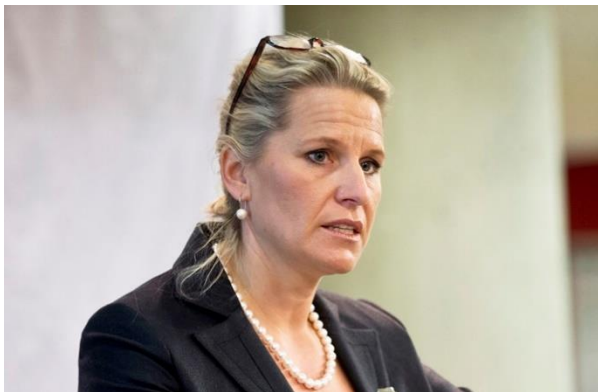
Präsidentin Martina Bandte

Bildunterschrift: „Planwirtschaftliche Auflagen und sinnentleerte Regulierung führen zu Firmensterben und Abwanderung. Nur mit schonungsloser Entbürokratisierung, Deregulierung und der Senkung von Steuern und Abgaben werden wir international wieder wettbewerbsfähig. Wir unterstützen den Wirtschaftswarntag, damit Unternehmer weiterhin in Eigenverantwortung im weltweiten Wettbewerb bestehen können.“